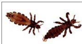
vrouwlijes-luis (links) mannetjes-luis (rechts)